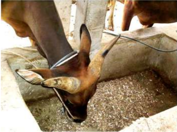
Gambar 1. Sapi yang diberi ransum tersusun dari beberapa jenis limbah pertanian dalam bentuk kering (foto diambil dari lokasi salah satu rekan SMD)

Pada umumnya kualitas limbah sebagai pakan sangat rendah sehingga perlu adanya upaya perbaikan pengelolaannya untuk menjadi pakan ternak yang dapat meningkatkan produktivitas ternak.