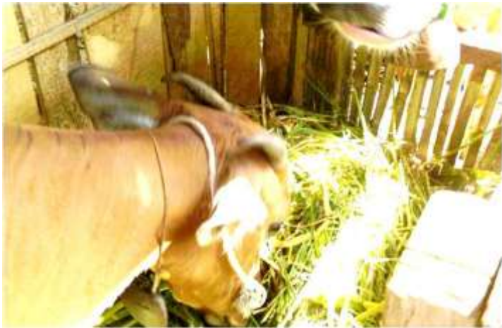
Gambar 5. Sapi diberi pakan jerami padi segar