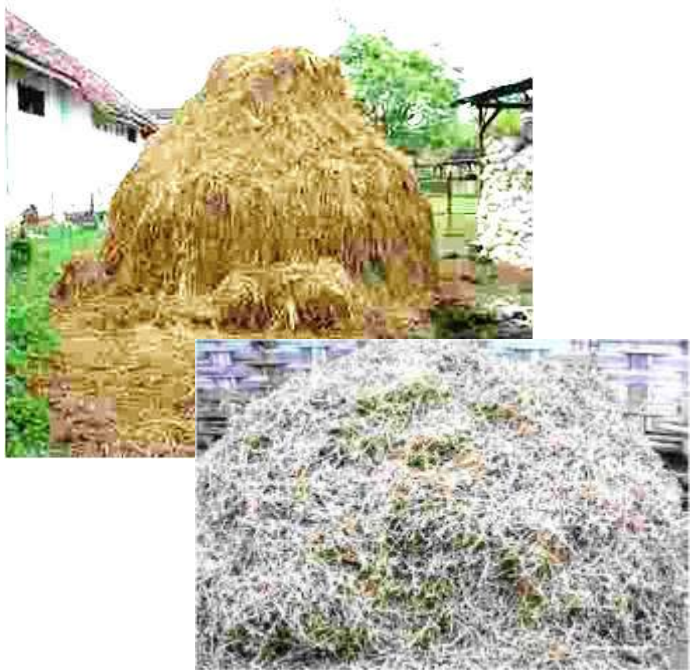
Gambar 2. Jerami padi dan jerami kedelai