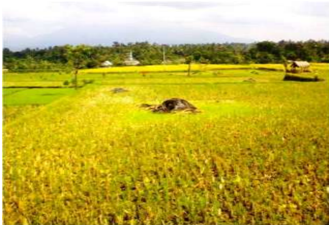
Gambar 1. Jerami padi dibakar setelah panen

Di Nusa Tenggara Barat tersedia limbah pertanian dan limbah agroindustri untuk bahan baku pakan dan belum dimanfaatkan secara optimal. Sebagian limbah-limbah tersebut terbuang atau dibakar yang berpotensi merusak lingkungan.