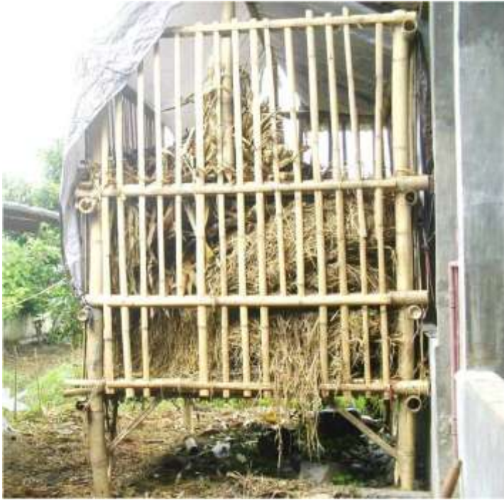
Gambar 4. Jerami dapat disimpan pada tempat yang dibuat sederhana dari bahan bambu