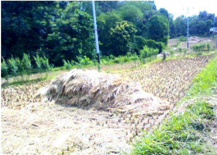
Gambar 3. Jerami padi setelah panen dikeringkan agar tidak terjadi kerusakan (busuk) saat disimpan.

Pakan yang akan diawetkan diproses dari bahan baku berupa tanaman hijau, limbah industri pertanian, serta bahan pakan alami lainnya, dengan kadar /kandungan air berkisar antara 40-80%, kemudian dimasukkan dalam sebuah tempat yang tertutup rapat kedap udara yang disebut silo. Proses fermentasi yang dibutuhkan untuk pembuatan silase lebih kurang 3 minggu dan hasil proses fermentasi dapat disimpan selama 4-8 bulan.