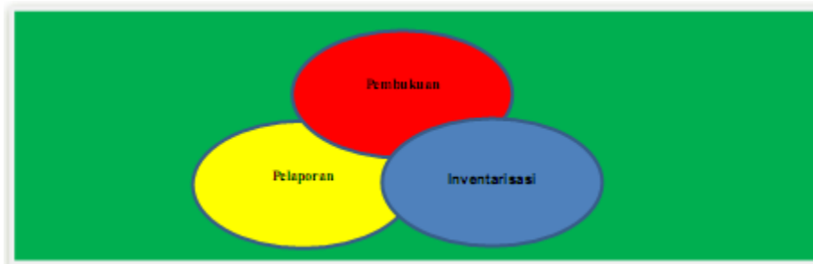
Gambar 1. Proses Penatausahaan Barang Milik Negara

Penatausahaan Barang Milik Negara bertujuan untuk mewujudkan tertib administrasi dan mendukung tertib pengelolaan Barang Milik Negara yang meliputi penatausahaan pada Kuasa Pengguna Barang/Pengguna Barang serta Pengelola Barang sebagaimana diatur dalam Peraturan Menteri Keuangan Nomor: 181/PMK.06/2016 tentang Penatausahaan Barang Milik Negara.