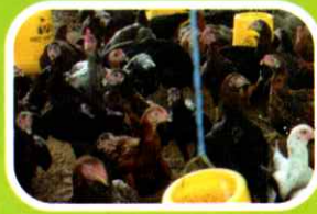
Gambar 4: tempat pakan dan minum ayam di kandang