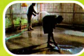
Gambar 5: pembersihan kandang setelah panen.

Bersihkan kandang secara periodik. Setelah panen, istirahatkan kandang selama 2 minggu dan semprot menggunakan desinfektan sebelum ayam masuk. Hal ini agar kandang bersih dari bibit-bibit penyakit.