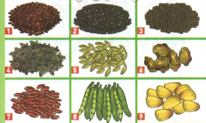
1. Biji kangkung, 2. bayam, 3. sawi, 4. oyong, 5. timun, 6. paria, 7. kacang panjang, 8. buncis, 9. jagung manis